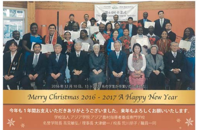
アジア学院よりの礼状

創設以来の先輩会員の寄付に感謝いたしますと共に、今後も当クラブの伝統であります、米山奨学会へのご理解と寄付につきまして何卒よろしくご協力の程お願いたします。