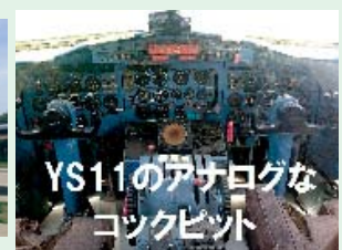
YS11のアナログなコックピット