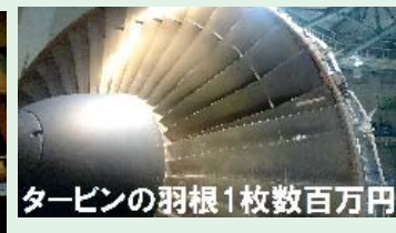
タービンの羽根1枚数百万円